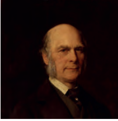
İngiliz bilim adamı Francis Galton (1822 - 1911), modern anlamda öjeni kavramını ortaya atan ilk kişi olarak tanınıyor.