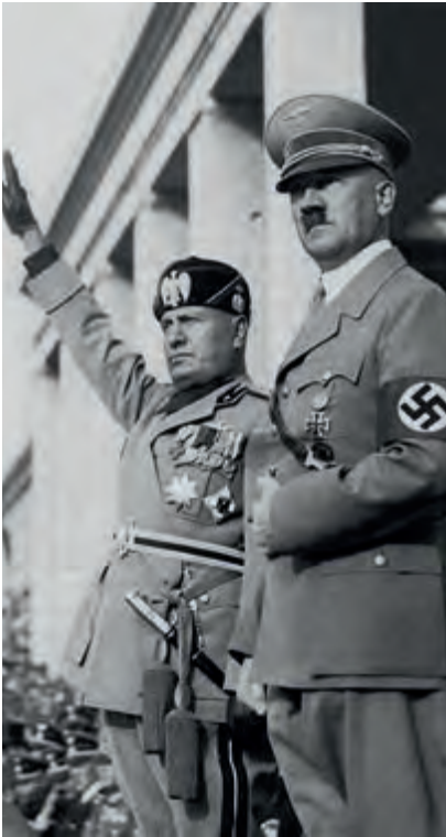
Hitler ve Mussolini, öjeni konusunda en kötü şöhrete sahip olanların başında geliyor.