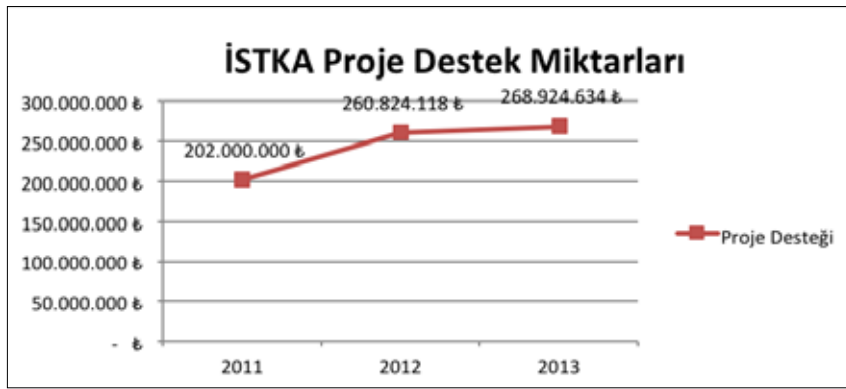
Şekil 2: Yıllara göre STKA proje destek miktarları

almak. Nitekim bu iki konunun, İSTKA'nın belirlediği destek çağrı alanlarının ve Bölge Planındaki önceliklerin ekseninde yer aldığını görmek mümkün.