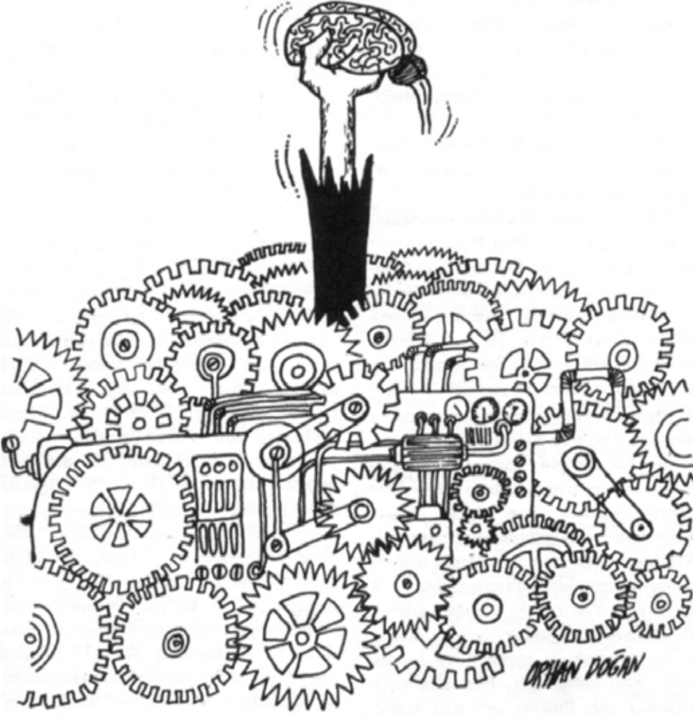
Karikatür: Orhan Doğan

Doktor vizite gelmişti. Teyze doktoru görür görmez şiddetle itiraz etti: