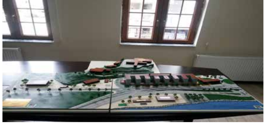
Recep Tayyip Erdoğan Üniversitesi Sağlık Külliyesi Maketi

klinik hariç) kayda değer hiç bir şikâyet vuku bulmadı... Rektörlükle ilişkileri, bazitahi zaten tüm diğer disiplinlerden farklı olan işini iyi bilen, bu kutsal mesleği layıkıyla uygulayan-uygulamaya çalışan birim amiri konumunda onurla yürüttük. Sağlık Bakanlığı Kamu Hastaneleri İl Genel Sekreteri ve EAH Başhekimi ile olan, aslında mevzuatın tetiklediği yetki karmaşası ve sıkıntıları ise kişisel “ağır abi” konumumu(!) değerlendirerek çözüme yoluna gittik.