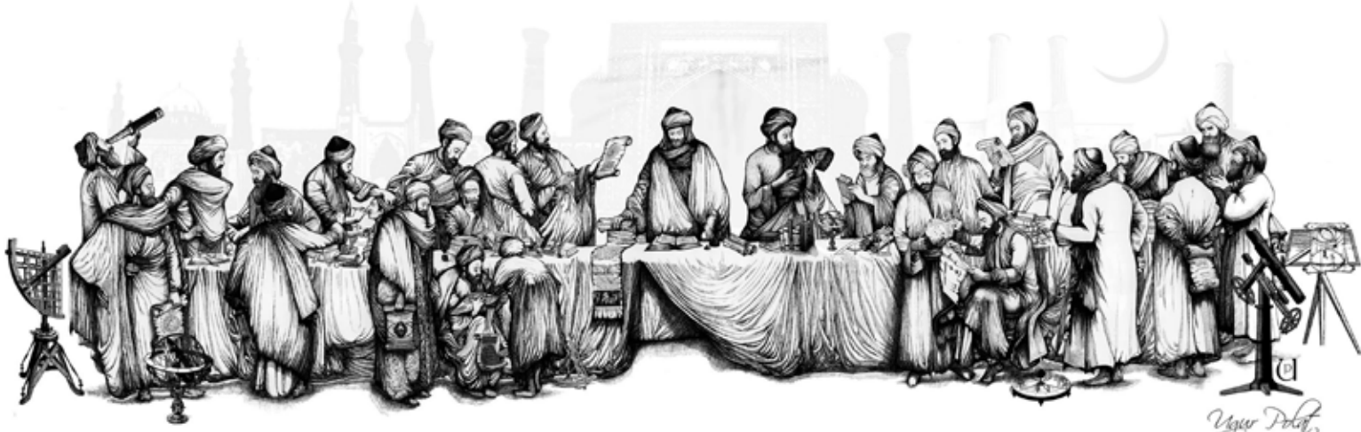
Arka sıra soldan sağa: Fergâni, Kemaleddin Fârîsi, İbnü'n Nefîs, İbn Sinâ, Zehrâvi, Cabir bin Hayyan, Ali Kuşçu, Uluğ Bey, Birüni, Cezerî, Harizmi, Sabit bin Kurra, Bûzcanî, Ebu Kâmil Şucâ, İbn Fîrnas Ön sıra soldan sağa: Ömer Hayyam, Takîyyüddîn, İbnü'l Heysem, Bitrûcî, İbn Türk, İbnü's Şâtîr, Hâzîni, Bettâni, Râzî, Nasîrüddîn Tûsî

ve değişmeyen bir şey demek değildir. Güzelin idesi/hakikati ile güzelin kendisi aynı şeydir. Güzelle ilgili Platon ve Aristoteles sonrası müstakil bir metafizik felsefe kuran bir diğer isim Plotinus'tur. Plotinus, Aristoteles ve Platon tarafından tartışılan estetik problemleri metafizik, epistemolojik ve psikolojik açıdan ele alan bir felsefe geleneği inşa etmiştir. Plotinus'a göre sanatın amacı, duyuusal seviyenin ardında, aşkın ve ruhani alanla ilişkilidir ve sanat duyuusal alandan ahlâka uzanan geniş bir alanı kaplamaktadır. Estetik tecrübe yalnızca 'bir'e ve 'iyi'ye ulaşmak için bir araç olarak ele alınarak metafizik bir tecrübeye benzer bir tarzda değerlendirilmek suretiyle farklı bir anlam kazanmıştır.