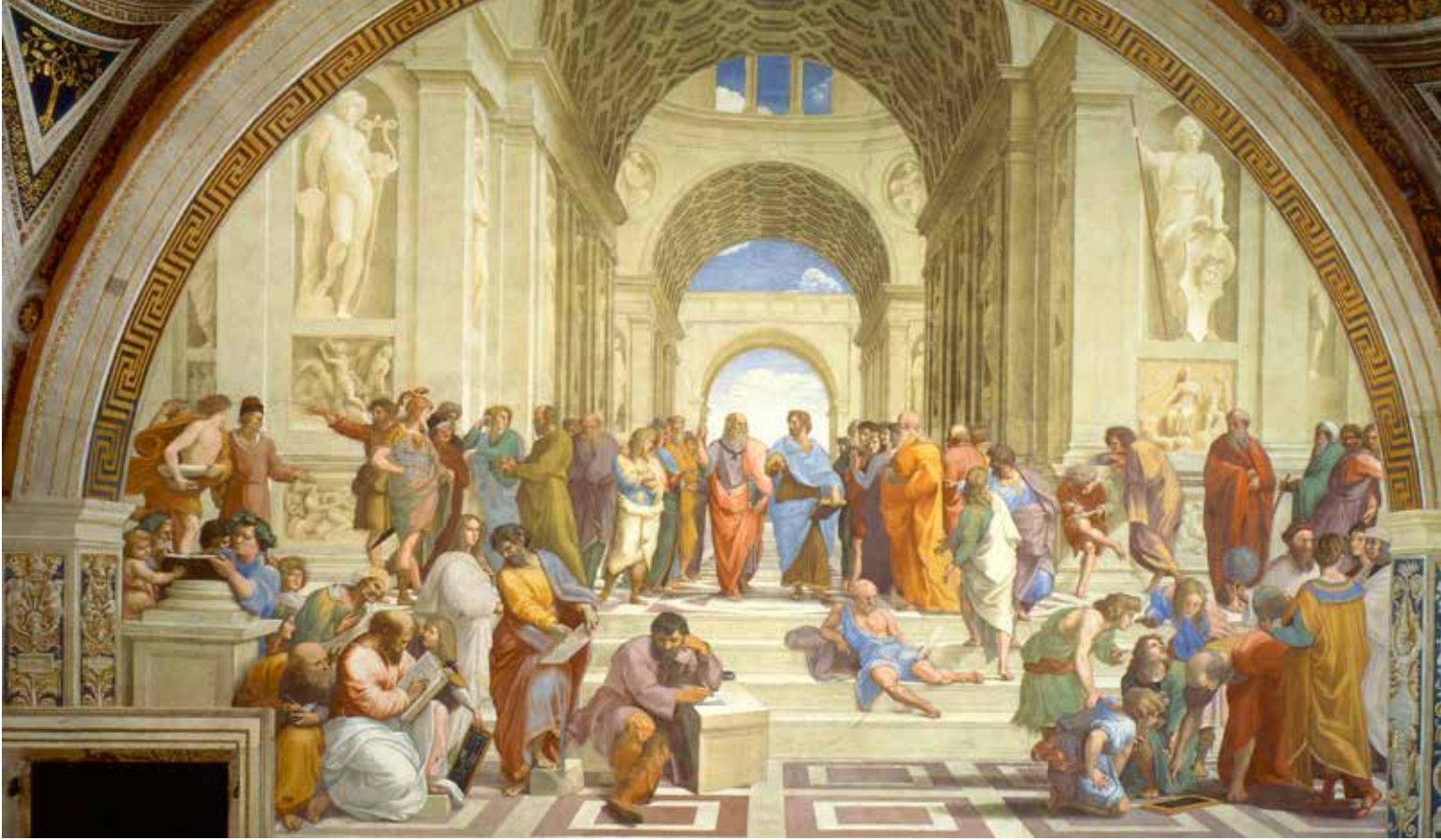
Rafaello, Atina Okulu (1510-1511)

Platon’dan sonra öğrencisi Aristoteles’e göre ise iyi ve güzel olan şey, sonsuz olan