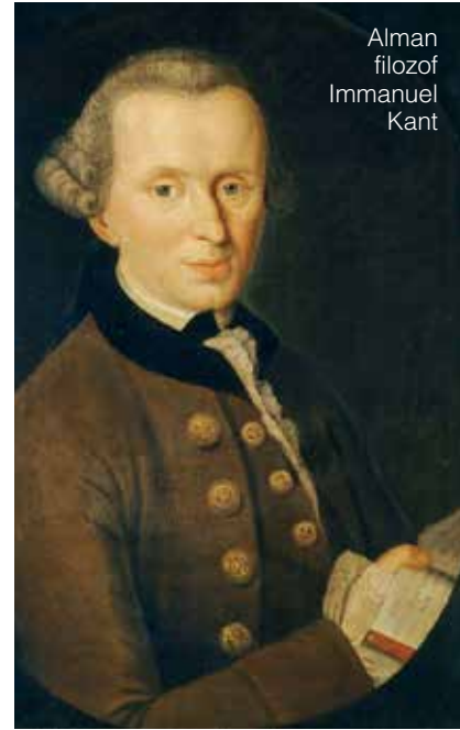
Alman filozof Immanuel Kant

Baumgarten, Yunanca duyularla ilgili olan anlamına gelen "aisthesis" kavramında karar kılarak buna "estetik" adını verdi. Bu atılımdan sonra Baumgarten, zihinsel güçler dünyasında duyguya çok daha fazla önem verilmesi gerektiğini işaret etti. Baumgarten'e göre estetik, insanda açık-seçik olanın ötesinde var olan bir tasavvurlar bütünüdür. Kısaca söylemek gerekirse, Baumgarten'e göre bilgi yalnız mantık biliminin konusu değil, aynı zamanda estetiğin de ulaşmaya çalıştığı nihai gayedir. Bu doğrultuda hem estetiğin hem de